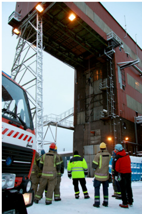
Redningspersonellet iakttar at alt gjøres klar for tauredning ned fra sinterverkets femte etasje.