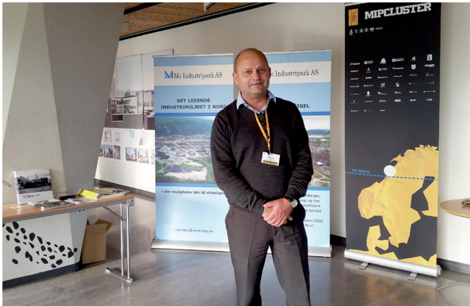
Motiv der MIP-profilering er tydelig fra Industri2014