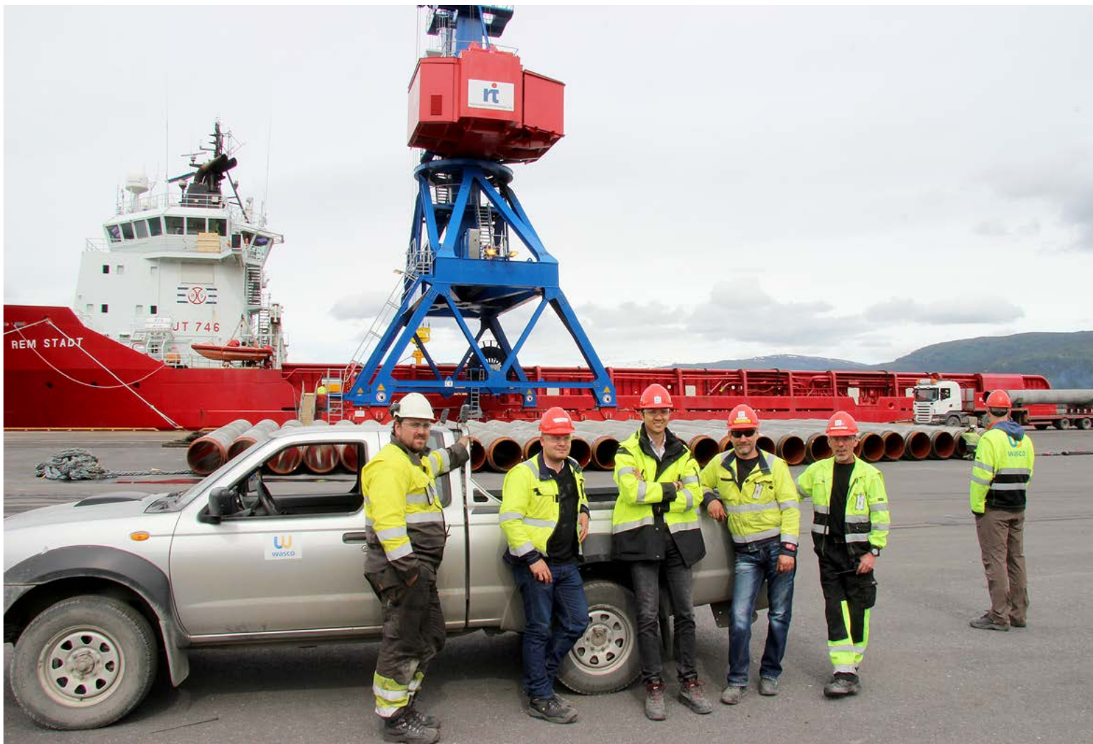
Rem Stadt er i ferd med å legge til kai. Dette er en viktig dag for Wasco Coatings Norway AS, der ansatte er klar til jobben med utskipping av rørene. De første rørene er om bord, og i alt ble det lastet om lag 160 rør, før supplybåten satte kursen ut mot Aasta Hansteen og Polarled.